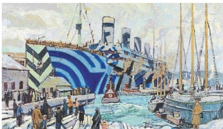
L'« Olympic » rapatriant des soldats, une peinture d'Arthur Lismer exposée au musée de la Marine.