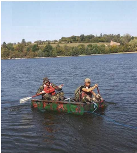
La traversée lac du Val Joly en radeau de fortune.

L'Amicale des cadres de réserve d'Avesnes-sur-Helpe (59) a organisé du 18 au 20 septembre 2020, la Transavesnoise, une marche d'orientation d'environ 28 km.