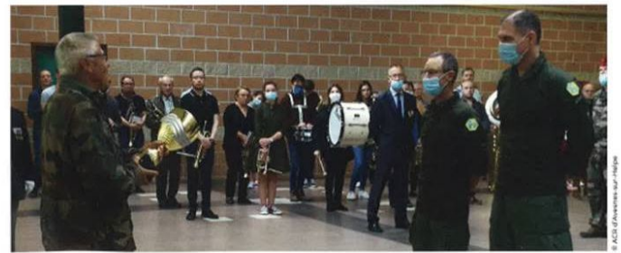
Remise du trophée Robert Crapet aux représentants de l'équipe de l'Association des réservistes citoyens de l'Oise (ARCI 60) qui décrochent la première place du classement général.

C'est la première fois qu'une équipe de réservistes citoyens remporte l'épreuve, affirmation de leur capacité physique et de leur technique d'orientation. Sur la deuxième marche du podium, on trouve l'équipe Les Aigles de la BA 107 de Villacoublay (78) qui devance l'équipe Les Aquilas, également de la BA 107. Notons également, la très belle performance de l'équipe d'enseignants, animateur de l'atelier défense du lycée St-Luc de Cambrai qui s'est classée 6 e de l'épreuve. ■