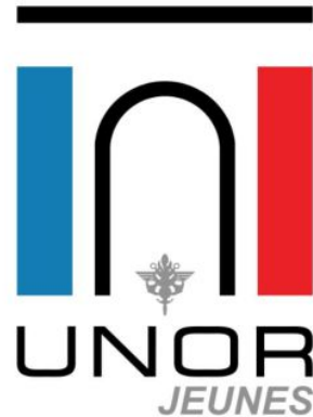
logo de la délégation « Jeunes » de l'UNOR

Les informations communiquées restent sous la responsabilité de la personne les ayant transmises